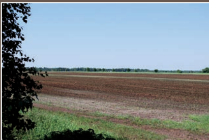
Beeinträchtigte Moore sind prädestiniert für eine RPP-Zertifizierung.