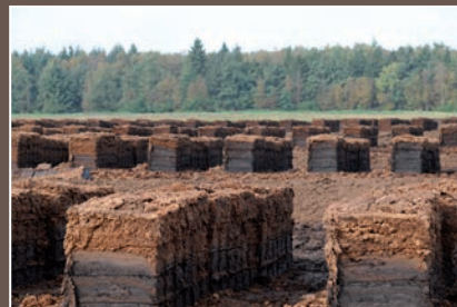
Während des Abbaus sollen negative Auswirkungen minimiert werden.